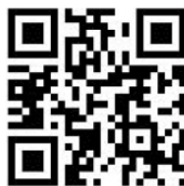
Avvisi e News